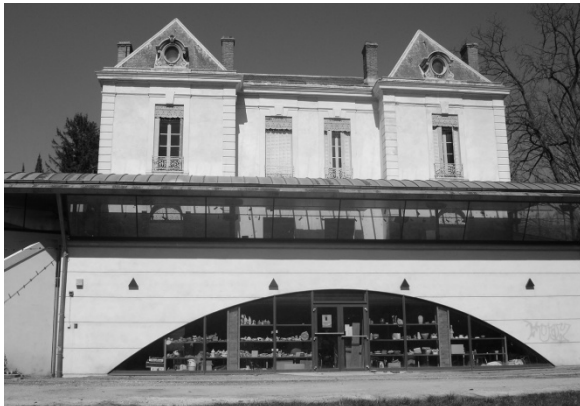
La Maison de la Céramique du Pays de Dieulefit

Avis: Nous recherchons en vue de nos expositions des poteries de Dieulefit, des archives papier ou photos liées à l'activité potière du Pays de Dieulefit, ainsi que des photos ou cartes postales sur la Maison du Parc de la Baume.